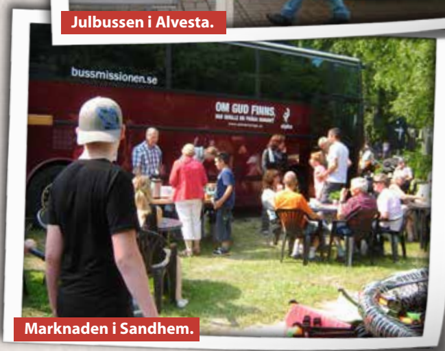
Marknaden i Sandhem.