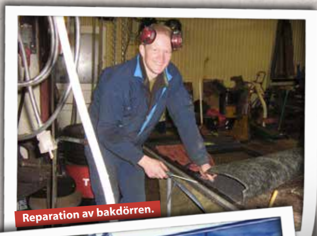
Reparation av bakhjulet.