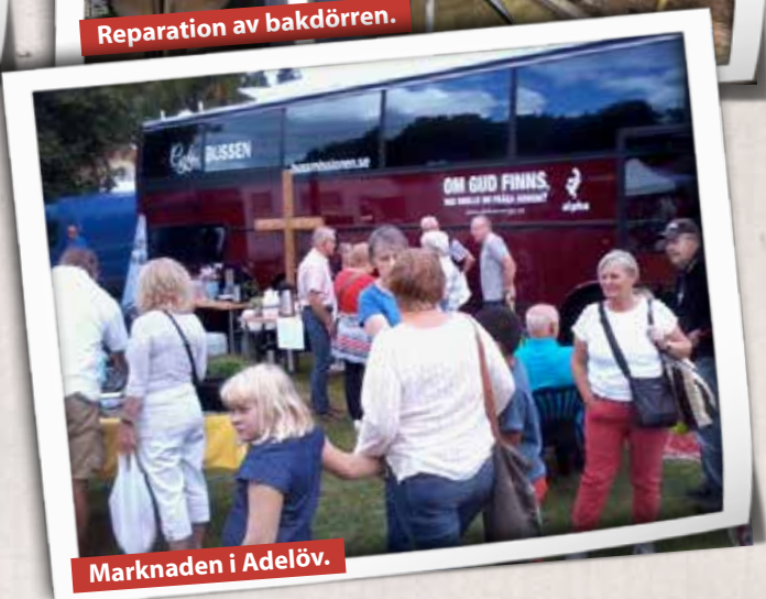
Marknaden i Adelöv.