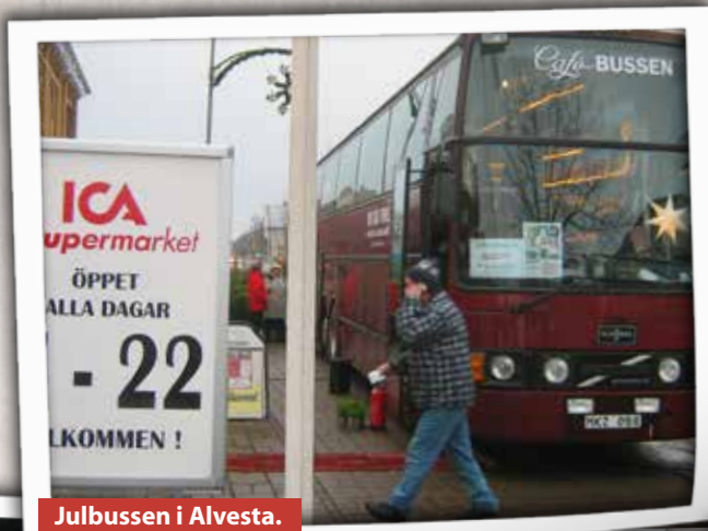
Julbussen i Alvesta.