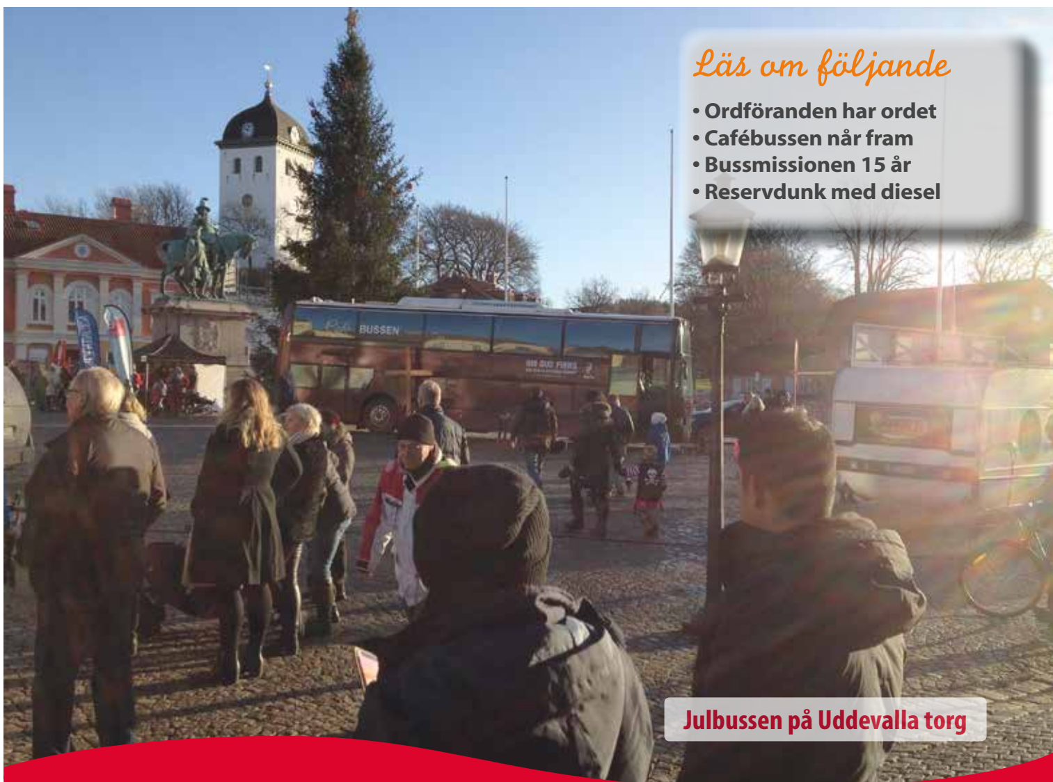
Julbussen på Uddevalla torg