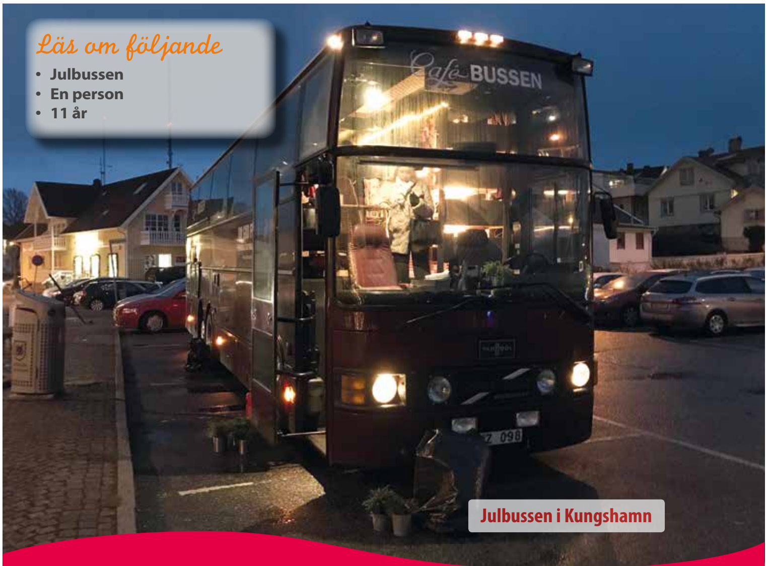
Julbussen i Kungshamn