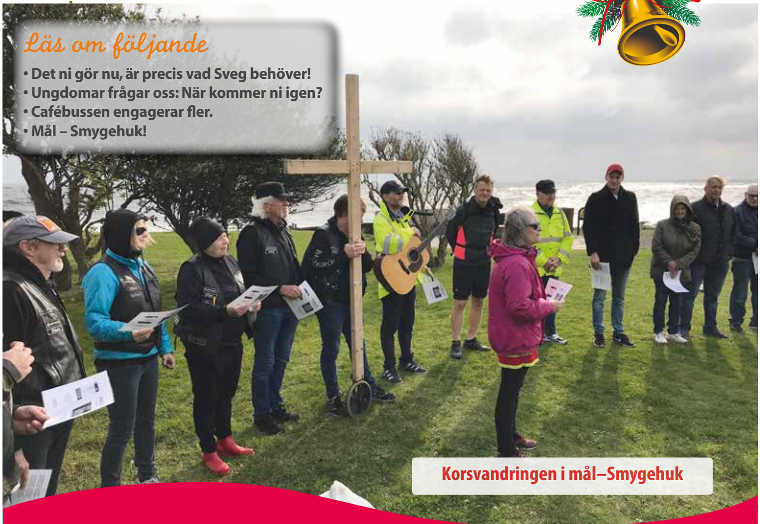
Korsvandringen i mål – Smygehuk