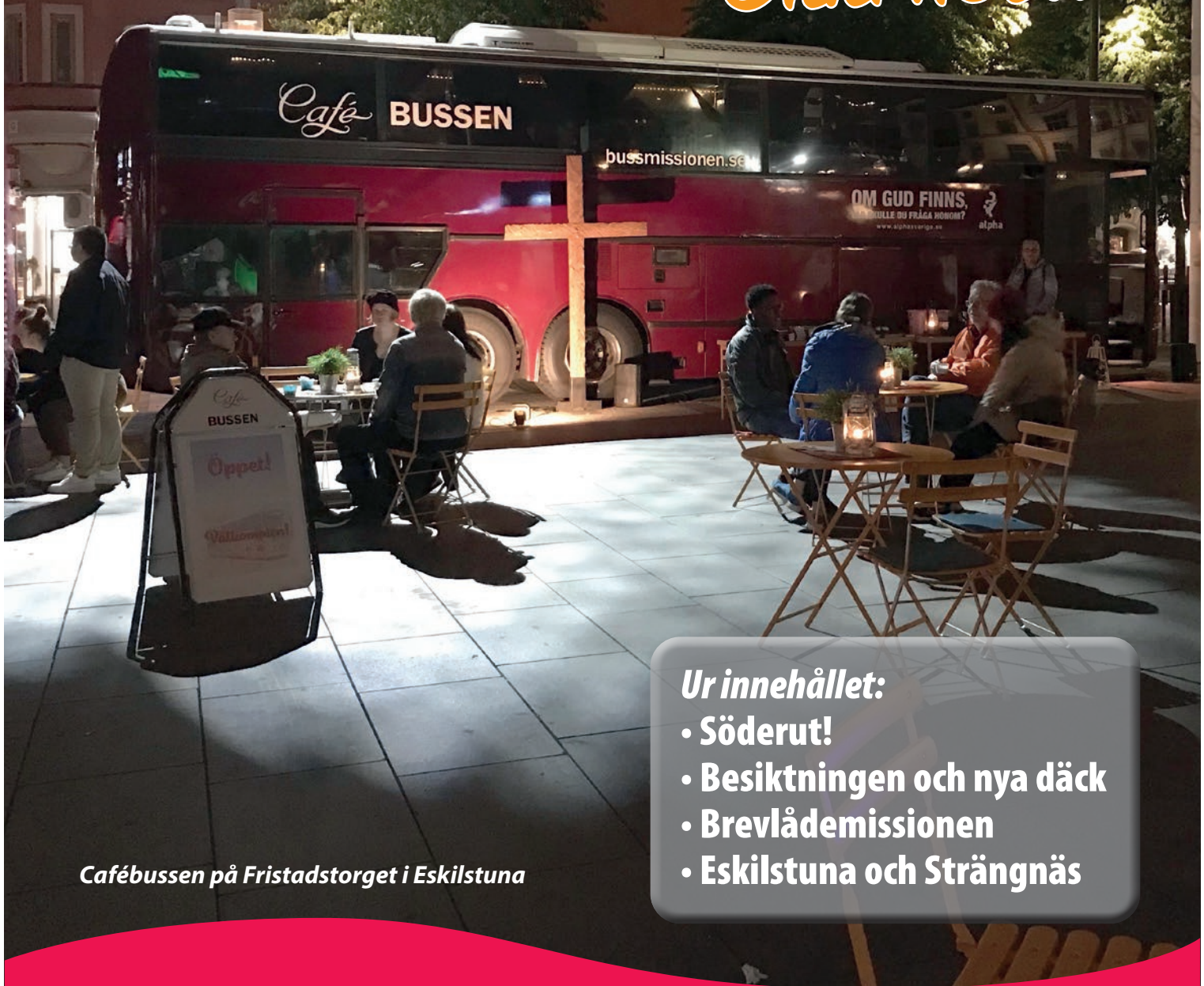
Cafébussen på Fristadstorget i Eskilstuna